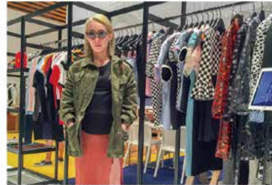
新ブランド「GROWING PAINS」を掲げるマドモアゼル・ユリア